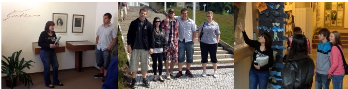
studenti třídy N1.

V pátek 21. června 2013 navštívila naše třída N1. Městské muzeum v Mariánských Lázních. Toto muzeum bylo založeno již v roce 1887 a sídlí v nejstarším dochovaném domě ve městě. Prohlédli jsme si prostory, které obýval Johann Wolfgang Goethe. Další expozice byly věnovány historii města a balneologickému vývoji. Po prohlídce muzea jsme se prošli po kolonádě a ochutnali jeden z léčivých pramenů. Na závěr naší exkurze nás čekal chutný oběd v pizzerii Tabarin.